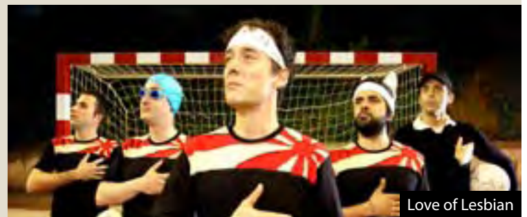
Love of Lesbian

Per apuntar-s'hi o demanar informació d'alguna activitat: brrqactivitats@gmail.com